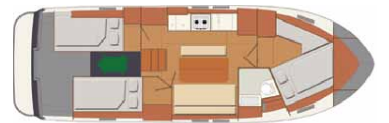
Interior D - 3 cabins