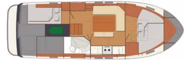
Interior B - 2 cabins