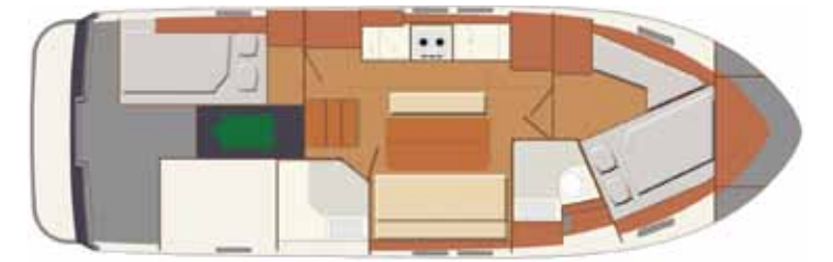
Interior A - 2 cabins