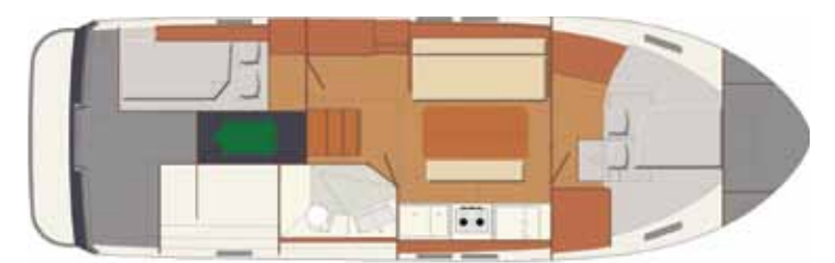
Interior C - 2 cabins