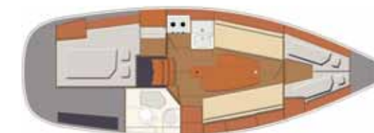
Interior Ballast version - 2 cabins