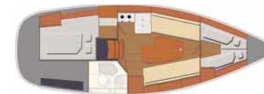
Interior Swing version - 2 cabins