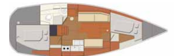
Interior Ballast version - 2 cabins