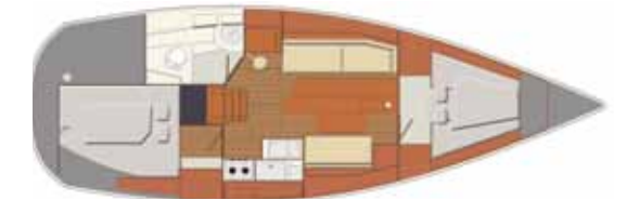
Interior Ballast version - 2 cabins