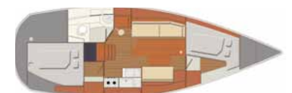
Interior Swing version - 2 cabins