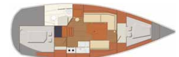
Interior Swing version - 2 cabins