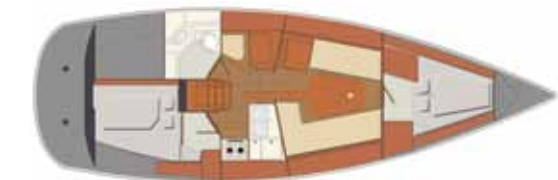
Interior Ballast version - 2 cabins