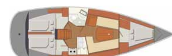
Interior Swing version - 3 cabins