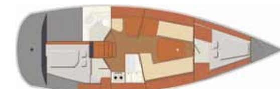
Interior Swing version - 2 cabins