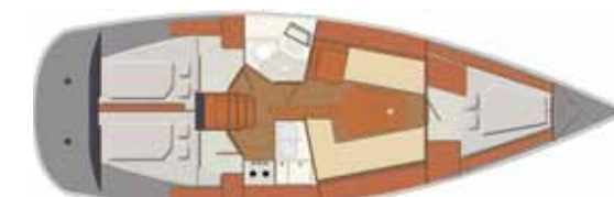
Interior Ballast version - 3 cabins